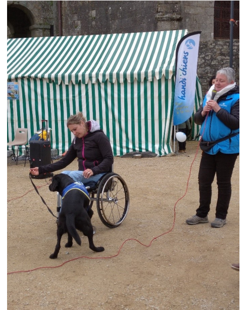
Les démonstrations d'Handichiens

Le public est venu nombreux admirer la pièce de théâtre réalisée par les élèves du collège et la compagnie Objeu, un projet réalisé en à peine quelques jours !