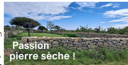
Passion pierre sèche !