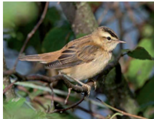
Phragmite des joncs