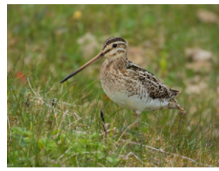
Bécassine des marais