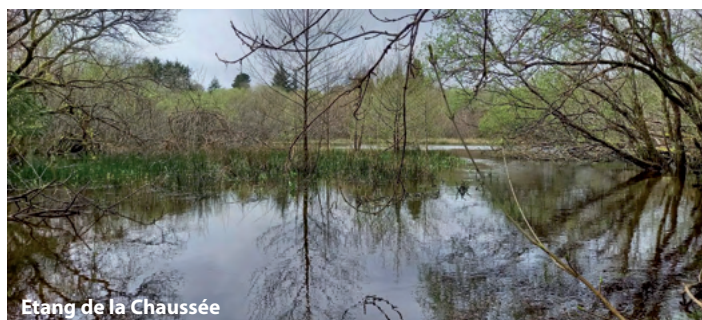
Etang de la Chaussée

La Bretagne, les Monts d'Arrée, Plouneour est une terre d'eau : source, marais, rus, ruisseaux, étang, prairie, ... autant de milieux classés en zone humide. Mais ce sont des milieux fragiles qui, avec l'abandon de leur exploitation pastorale et faute d'entretien, disparaissent ou voire même sont complètement détruits par drainage ou remblayage pour d'autres activités. De ce fait il est important d'agir et de prendre conscience de l'intérêt, de la richesse et de la beauté de ces milieux.