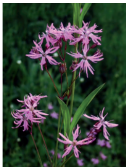
Lychnis fleur de coucou

Cette zone humide est une prairie généralement riveraine des cours d'eau, caractérisée par un engorgement de son sol en eau temporaire (l'hiver) par remontée de la nappe phréatique. La formation végétale herbacée caractéristique de la prairie humide ne se maintient, le plus souvent, que par l'entretien réalisé par la pratique agricole (fauche et/ou pâturage).