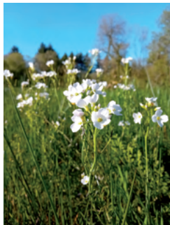
Cardamine des prés